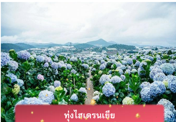
ทุ่งไฮเดรนเยีย

นำท่านเล่น นั่งโรลเลอร์โคสเตอร์ ชมธรรมชาติท่ามกลางป่าสนไปยัง น้ำตกตาดันลา สัมผัสอากาศบริสุทธิ์และบรรยากาศสดชื่น พร้อมจิบเครื่องดื่มชมวิวธรรมชาติ นำท่านเดินทางสู่ ทุ่งไฮเดรนเยีย อีกหนึ่งทุ่งดอกไม้ ที่ไม่ควรพลาดมาถ่ายรูปกัน ข้อดีของที่นี่ คือ ดอกไม้จะบานตลอดทั้งปี