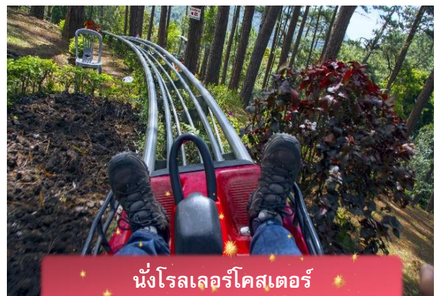
นั่งโรลเลอร์โคสเตอร์