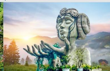
โมอาน่าคาเฟ่

*ทางบริษัทฯ ขอสงวนสิทธิ์ในการสลับโปรแกรมทัวร์ตามความเหมาะสมขึ้นอยู่กับสถานการณ์หน้างาน โดยคำนึงถึงผลประโยชน์ของลูกค้าเป็นสำคัญ