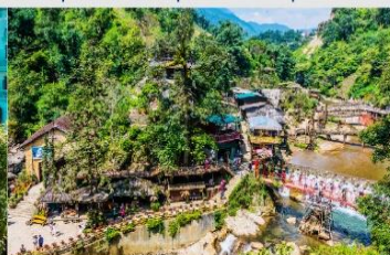
หมู่บ้านก๊ต ก๊ต