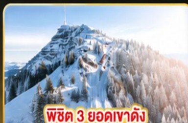
พีชิต 3 ยอดเขาดัง Rigi / Schilthorn / Gornergrat