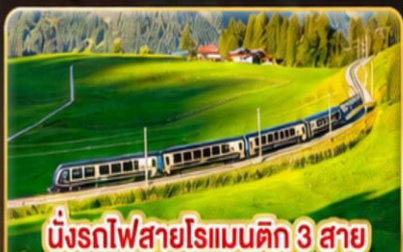
นั่งรถไฟสายโรเมนติก 3 สาย Golden Pass / Luzern Interlaken Express / Gornergrat