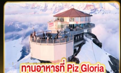
ทานอาหารที่ Piz Gloria ภัตตาคารที่หนูนได้ 360 องศา