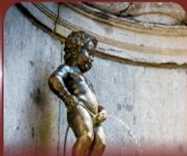
manneken pis บรัสเซลส์