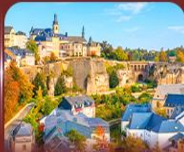
ย่านเมืองเก่า ลักเซมเบิร์ก