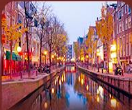
ย่าน Red Light อัมสเตอร์ดัม