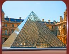
เข็มนาฬิกาพิพิธภัณฑ์ลูฟวร์ ปารีส