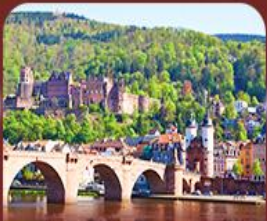
ชมเมืองสวย ไฮเดลเบิร์ก