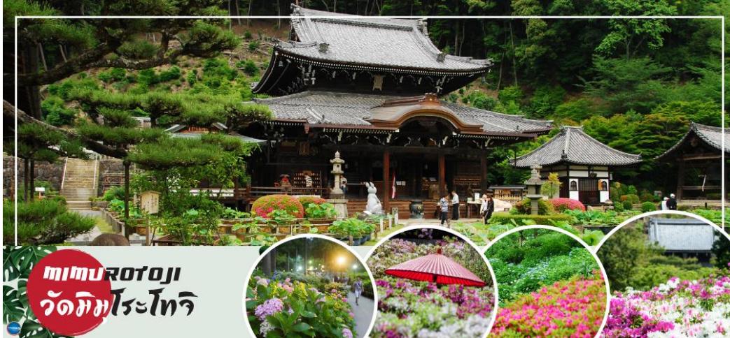
ดริม เอ้าท์เล็ท

01.15 น. เหนินฟ้าสู่ เมืองโอซาก้า ประเทศญี่ปุ่น โดยเที่ยวบินที่ XJ612