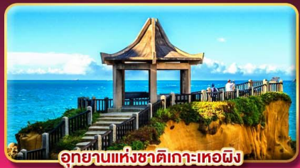
อุทยานแห่งชาติเกะเทอผิง

ชมพลุข้ามปี ฉลองเทศกาลปีใหม่ 2027 แช่น้ำแร่ส่วนตัวในห้องพัก