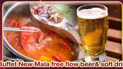
*Buffet New Mala free flow beer& soft drink