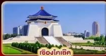
เขียงโกเท็ค