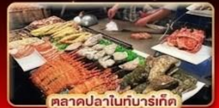
ตลาดปลาไถ่บ๋ารเกิด