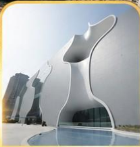
โรงละครไทจง