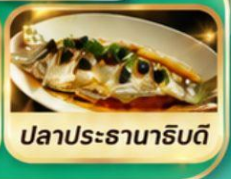
ปลาประธานาธิบดี